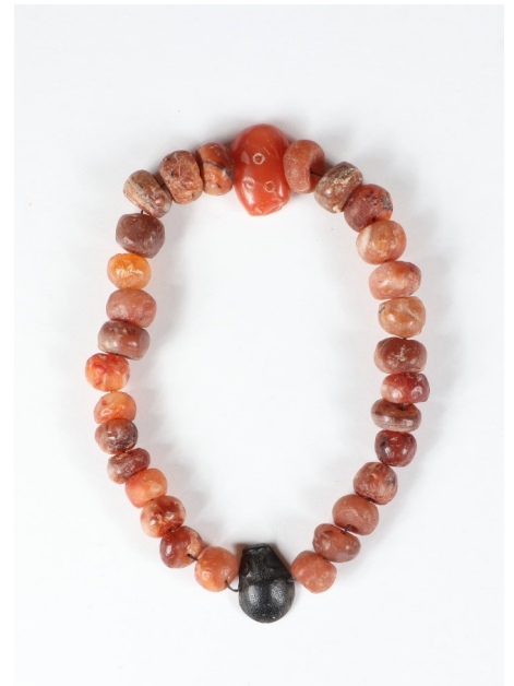
Collier au scarabée, 30 perles en sardoine et 1 stéatite noire Shirak regional museum inv. 3305/2 VIII-VII cc. B.C. Shirakavan, découverte fortuite en 1981 L. 32cm