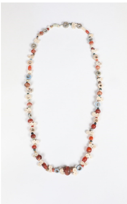
Parures en pierres, perles de cornaline, pierre et pâte Shirak regional museum inv. 4009/95 C. XI cc. B.C. Azatan, fouilles de 2013 Poids 39g.