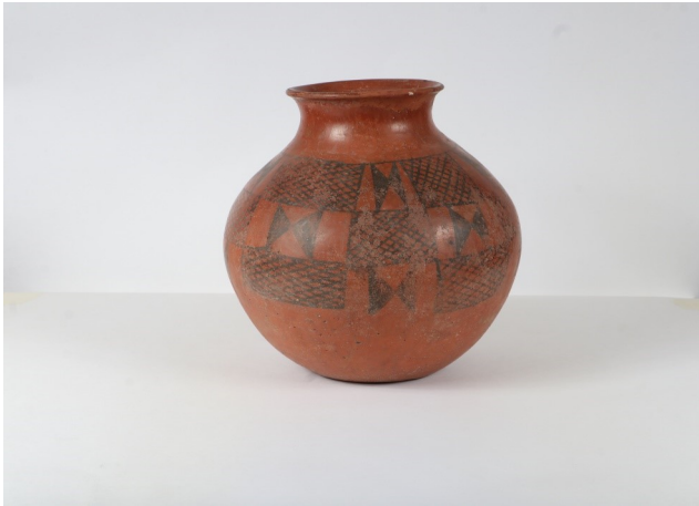
Vase globulaire aux nœuds papillon