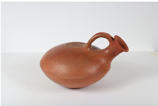
Askos circulaire, céramique