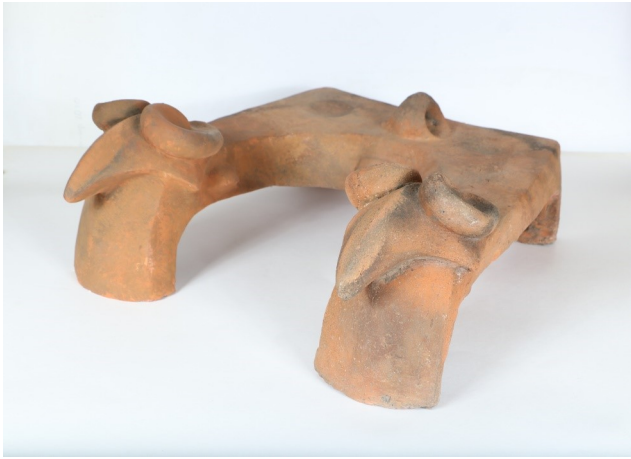
Andiron zoomorphe, céramique Shirak regional museum inv. 4157 XXVIII-XXVI cc. B.C. Mets Sepasar 2019 H. 11-19cm / W. 32-43cm / L. 40cm