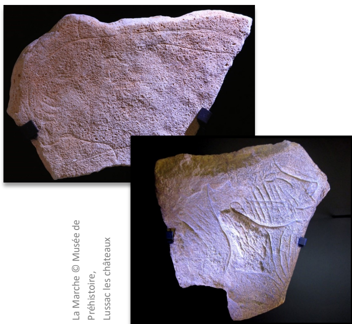
La Marche

Les pierres gravées, découvertes notamment dans les contextes magdaléniens de la célèbre grotte de La Marche de celle des Fadets datant environ de -15 000 ans ou encore dans les contextes magdaléniens et aziliens de la grotte du Bois-Ragot à Gouex, datant de -13 000 à -10 000 ans, sont les objets phares de ces collections. De petites, moyennes ou grandes dimensions, elles ont été découvertes par milliers dans la seule grotte de La Marche. Gravées de motifs géométriques, d'animaux, mais aussi et surtout de figurations humaines traitées de façon réaliste, ces pièces sont tout à fait exceptionnelles. Par leur quantité et leur qualité, ces œuvres d'art gravées sur mobilier caractérisent la spécificité de l'art préhistorique de Lussac-les-Châteaux à la période magdalénienne. Une place et une valorisation particulières leur sont donc consacrées dans le musée.